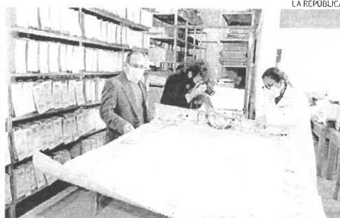
VALOR. El mapa del Perú dibujado en litografía en 1862.

La Dirección Desconcentrada de Cultura Cusco (DDCC) restaurará el mapa histórico del Perú de 1862 que se custodia en el Archivo Regional de la ciudad imperial.