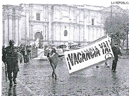
PROTESTAS. Decenas se movilizaron contra Castillo en Arequipa.

La movilización se desarrolló en medio de un lluvia torrencial. La manifestación partió desde la avenida Bolognesi en Yanahuara hasta la Plaza España en el Cercado. Antes pasó por la Plaza de Armas. El grito de "vacancia" predominó en gran parte de la manifestación, aunque también hubo otros lemas como "No al terrorismo". Al final de la protesta, se entonó el himno nacional y el grito de "Con lluvia, con frío, vacancia ya". En la Plaza de Armas hubo algunos cruces de palabras.